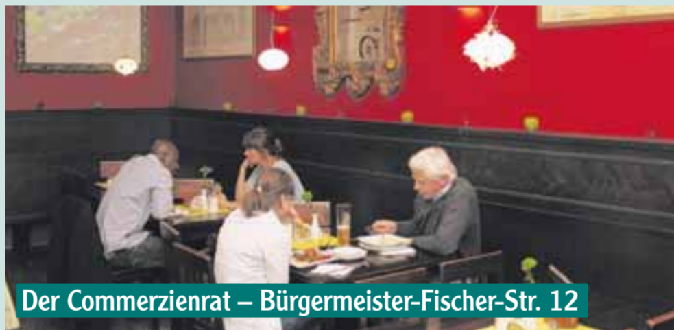
Der Commerzienrat – Bürgermeister-Fischer-Str. 12