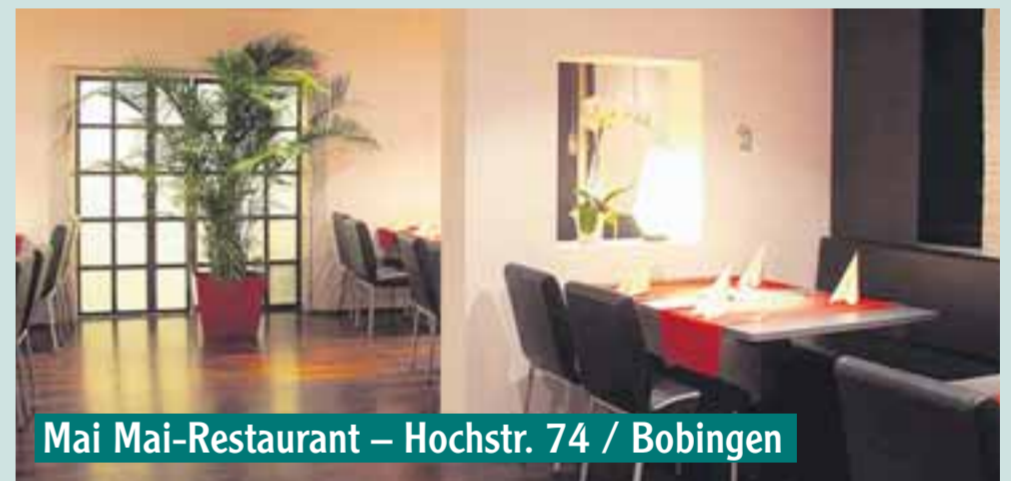
Mai Mai-Restaurant – Hochstr. 74 / Bobingen

Gültig in der Woche vom 29. 3. bis 2. 4. 2010