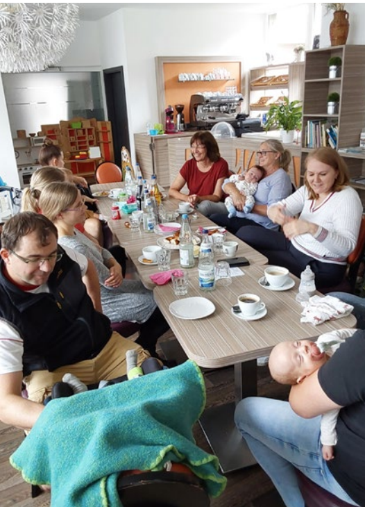
Freud und Leid teilen – das können Eltern frühgeborener Kinder bei den Treffen im Frühchencafé in Memmingen.

Wenn ein Kind viel zu früh auf die Welt kommt, ändert sich das Leben der Eltern und Geschwister schlagartig. Der Bunte Kreis begleitet diese Familien von Anfang an und unterstützt sie weit über den Klinikaufenthalt hinaus. In Memmingen gibt es jetzt ein weiteres Angebot – das Frühchencafé.