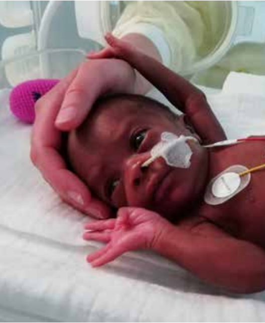
Gerade Frühchen brauchen liebevolle Berührungen und Muttermilch.