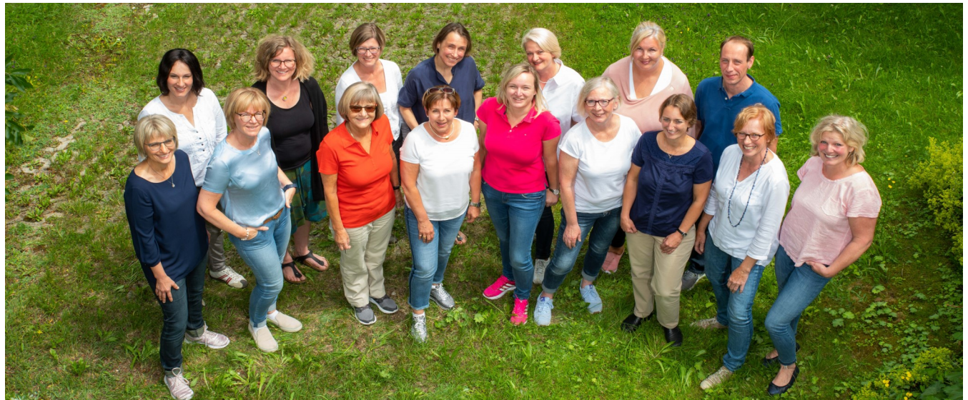
Brückenteam Allgäu und Augsburg

Wir sind bei den gesetzlichen Krankenkassen anerkannt als Leistungserbringer der Spezialisierten Ambulanten Palliativversorgung (SAPV) für Kinder und Jugendliche gemäß §132d i. V. m. §37b SGB V.